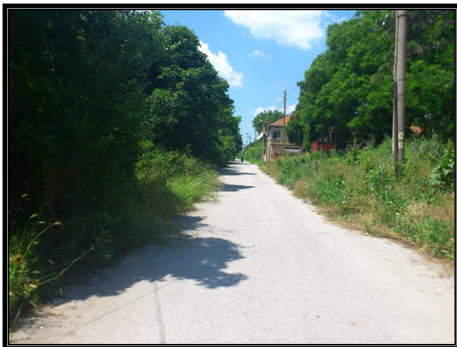
Участъка от ОТ 33 към ОТ 44