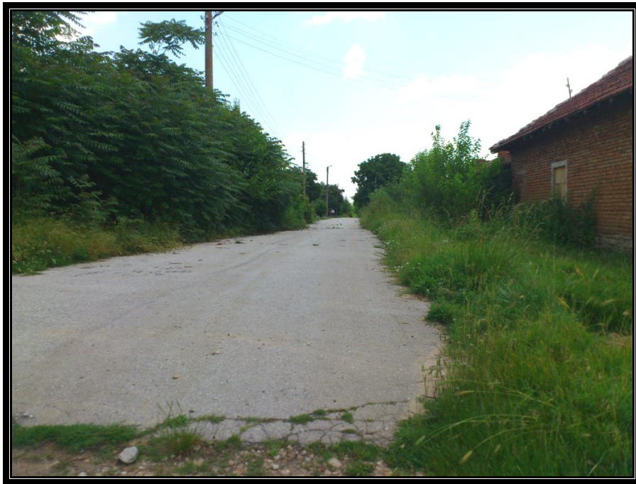
Края на улицата ОК 44