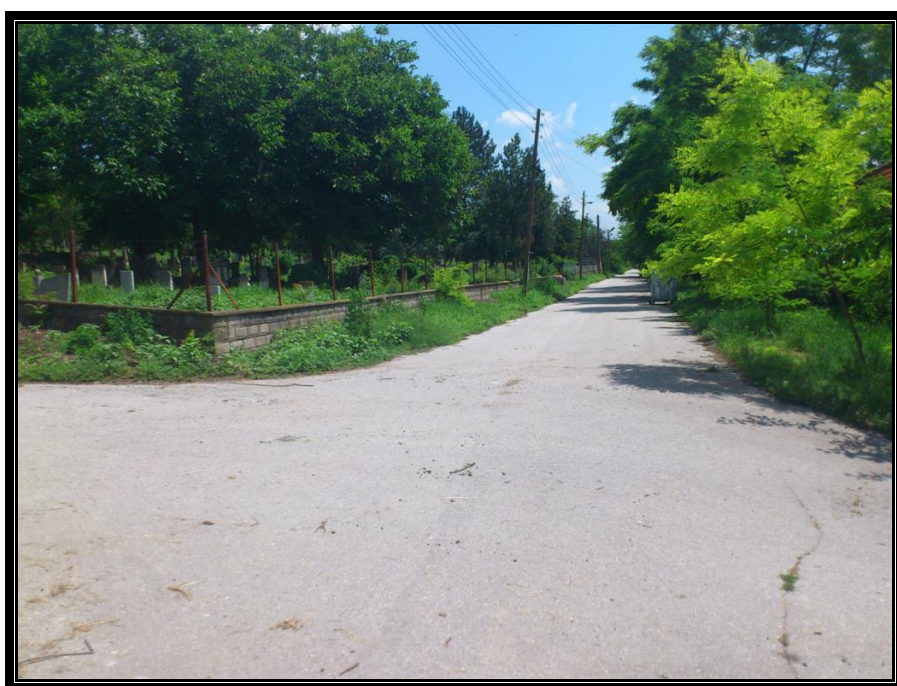
Кръстовище при гробищния парк