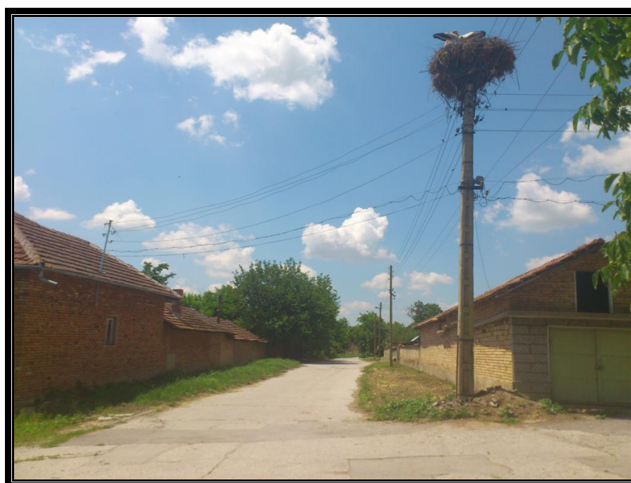
ОК 27 – начало на улицата